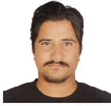
अन्तिम प्रसिद्ध धिताल

नेपाल विकासोन्मुख मुलुक हो र यसको समृद्धिको मूल चाबी भनेको पूर्वाधार निर्माण हो। पूर्वाधारको कुरा गर्दा इन्जिनियरिङ आफैमा त्यो मेरुदण्ड हो, जसले राष्ट्रको भौतिक, सामाजिक र आर्थिक विकासलाई सन्तुलित बनाउँछ। नेपाली समाजमा इन्जिनियरको योगदानको यथोचित मूल्याङ्कन, विश्लेषण र सम्मान गर्ने अवसरका रूपमा इन्जिनियरिङ दिवस (साउन ३) लाई लिने गरिन्छ। इन्जिनियरिङको औपचारिक इतिहास नेपालमा त्यति पुरानो नभए पनि यसको भूमिका आजका दिनमा भन्नु महत्त्वपूर्ण बन्दै गएको छ।