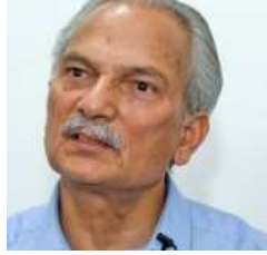
डा. बाबुराम भट्टराई

कृषिलाई प्राथमिकता, किसानलाई सम्मान र उत्पादनलाई सुरक्षा नदिने हो भने “कृषिप्रधान नेपाल” भन्ने वाक्य केवल इतिहासका पुस्तकमा सीमित भएर जानेछ।