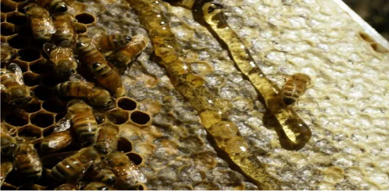
भैरोनिक ग्रीनवूड वीवीसी फ्यूचर

मह एक प्राकृतिक गुलियो पदार्थ हो। ब्याक्टेरिया, दुसी लगायतका सूक्ष्म कीटाणु चिनीजस्ता गुलियो पदार्थमा निकै फस्टाउँछन् तर मह सितमति विग्रदैन। महले त्यसरी सुक्ष्म कीटाणुलाई जित्ने क्षमताको कारण के होला?