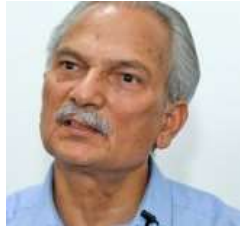
डा. बाबुराम भट्टराई

म आज आफ्नो जीवनको अत्यन्त खुसीको क्षणमध्ये एउटा मान्दछु। किनकि मान्छे जन्मेपछि जव आँखा खोल्छ र संसारलाई बुझ्छ, जगत के हो, दुनियाँ के हो, म किन जन्म, मैले के गर्नुपर्ने हो भन्ने प्रश्न गर्न थाल्छ, त्यसपछि नै उसले समाजलाई बदल्ने, रुपान्तरण गर्ने, अझ उन्नत बनाएर जाने, आफू मने बेलासम्म यो समाज, मानवजाति, प्राणी जगत उन्नत होस् भन्ने आकाङ्क्षा राख्छ।