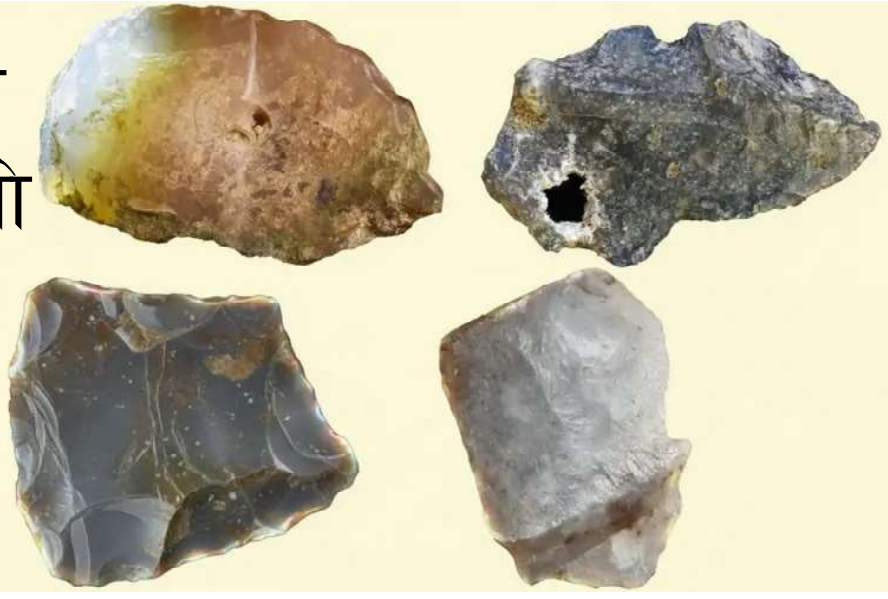
हेर्दा सामान्य लाग्ने यी ढुङ्गा दशौं लाख वर्ष पहिले एकदमै आधुनिक अनि निकै सीप र क्षमताले बनाइएका औजार हुन्